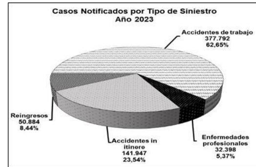
Cuadro 1 Gráfico 1 Casos notificados tipo de siniestro

Las enfermedades profesionales (EP) son sólo el 5,37% del total. Los Reingresos son para la SRT los casos que habiendo cesado la incapacidad laboral temporaria , reingresa al sistema a partir de una reagravación de su cuadro.